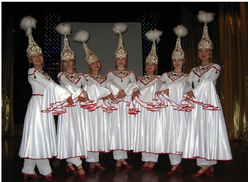
Студия народного танца