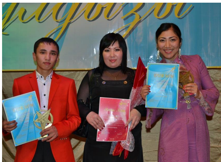
победители конкурса «Шағыс Жұлдызы» воспитанники вокальной студии