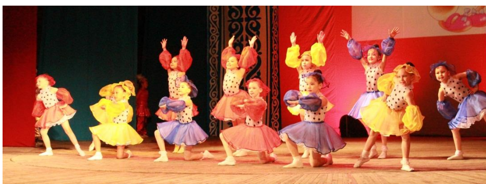
Танцевальная студия «Восток»