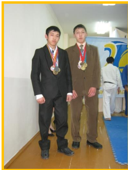
Чемпионы международных и Республиканских спортивных соревнований