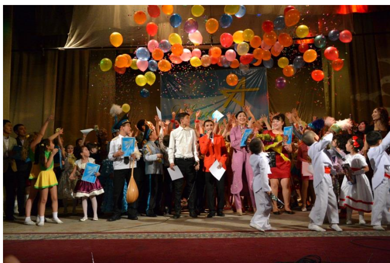
Региональный конкурс «Шығыс Жұлдызы»