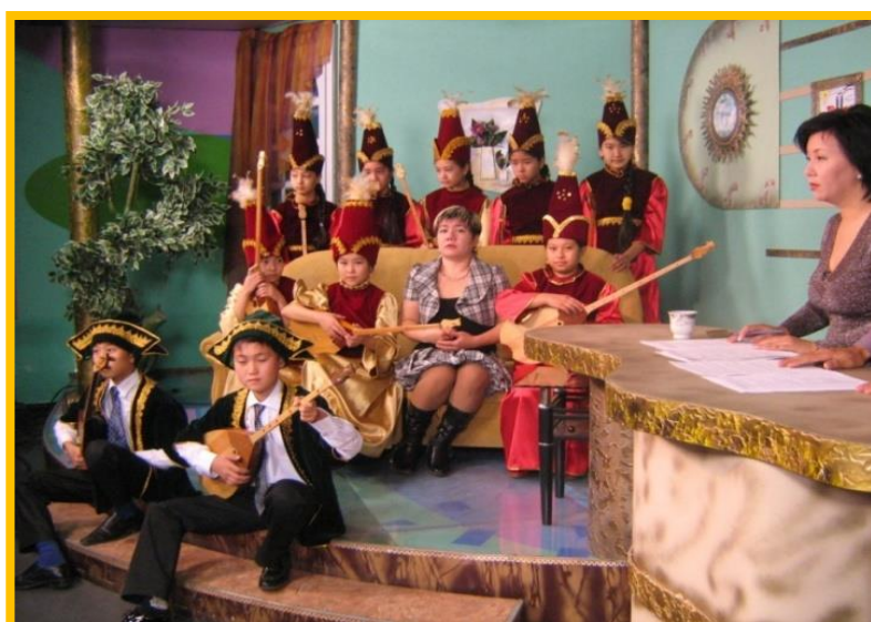
воспитанники домбрового ансамбля в студии прямого эфира телеканала «Казахстан -Семей»