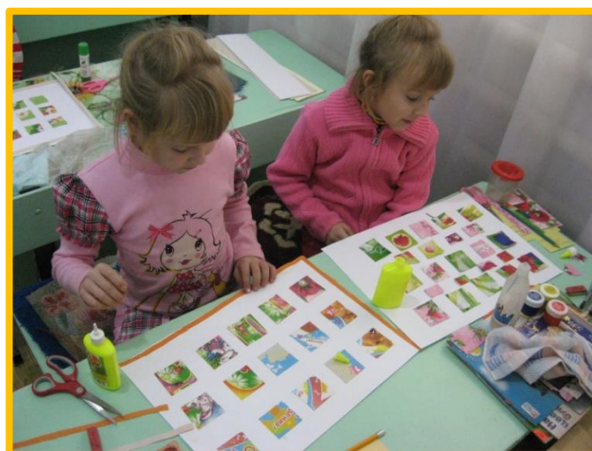
Воспитанники студии изобразительного искусства на занятии