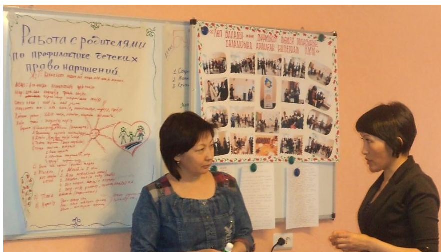
семинар с родительской общественностью