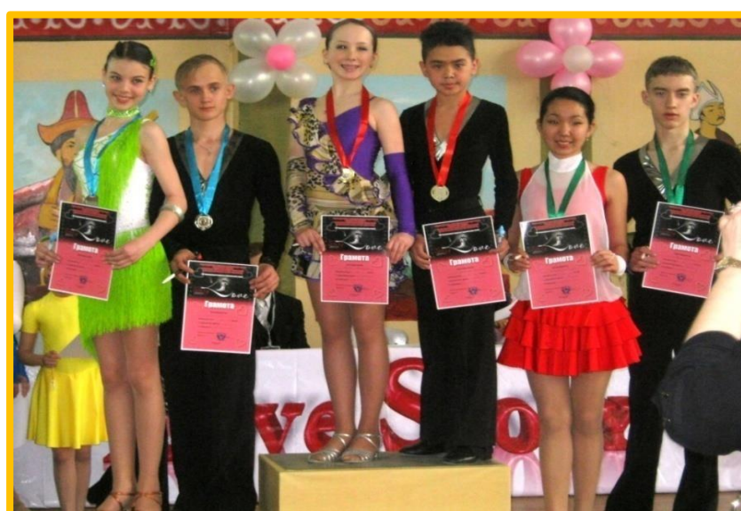
воспитанники студии спортивно- бального танца «Лариса» завоевали I, II, III места в Республиканском конкурсе