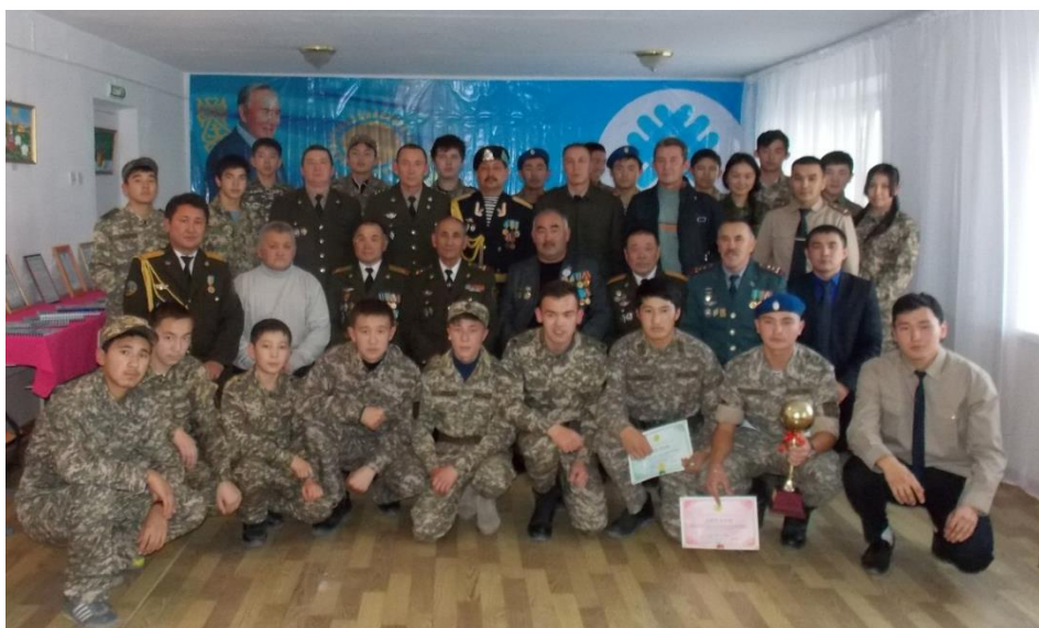
военно-патриотический клуб «Жас Канат»